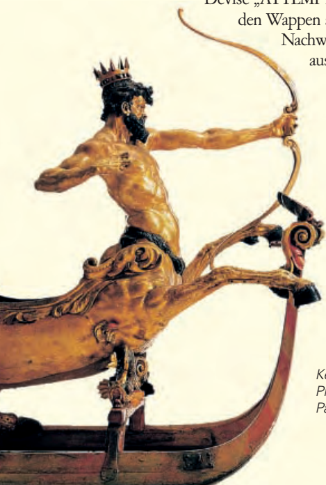
Kentaur. Frontfigur eines Prunkschlittens der Ulmer Patrizierfamilie Besserer

Ludwig stattete seine neue Hauptstadt rasch mit einem Residenzschloss aus. Ab 1443 wuchs nordwestlich einer schon bestehenden Wasserburg, die bis 1790 erhalten blieb, das neue Schloss empor. Auf dem Rechteck eines steinernen, ganz von der Dürnitz ausgefüllten Sockelgeschosses erheben sich zwei weitere Geschosse mit den Repräsentations- und Wohnräumen. 1445 wurde hier Graf Eberhard im Bart geboren. Er trat nach dem frühen Tode seines Vaters Ludwig vierzehnjährig die Regierung an und stattete das Schloss vor seiner Hochzeit mit Barbara Gonzaga von Mantua 1474 prachtvoll aus. Die zunächst flachgedeckte Dürnitz erhielt ein Kreuzrippengewölbe, der Festsaal im ersten Geschoss („Palmensaal“) wurde mit monumentalen Palmen, Eberhards Devise „ATTEMPTO“ (ich wag's) und den Wappen seiner Urgroßeltern als Nachweis hoher Abstammung ausgemalt.